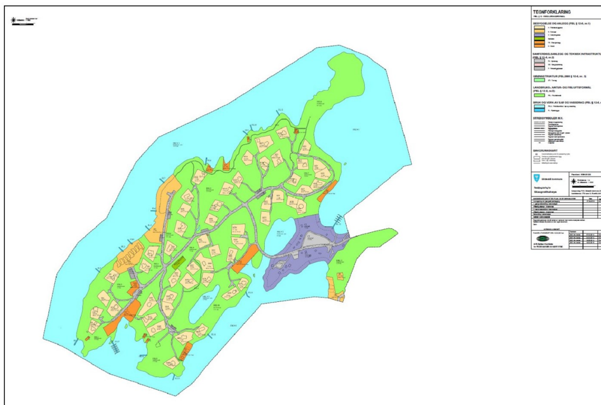
Figur 1: planforslag Skauvolløya

Siden reguleringsplan Skauvollhalvøya ble vedtatt i 2002 er det gjennomført mange endringer og gitt dispensasjoner fra planen. Planen ble endret i 2006 og deretter er det igjen gitt dispensasjoner fra planen. Plankartet som i dag er gjeldende er ikke lenger aktuelt. Grunneiere har behov for endringer av bestemmelser for å kunne bygge naust, uthus, opparbeide veier, større hytter, osv. Det er kommet inn et forslag på reguleringsendringer der både kart og bestemmelser er justert og oppdatert. Planforslaget er med noen endringer lagt ut til høring. I høringsperioden er det kommet inn 6 uttalelser.