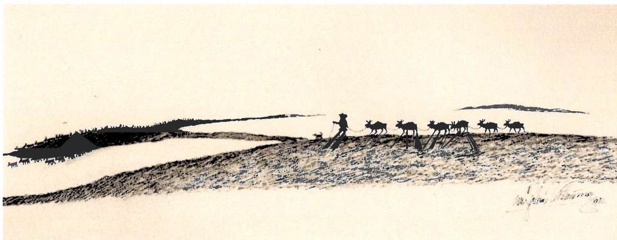
Tegnet av Lars Johannes Kuhmunen