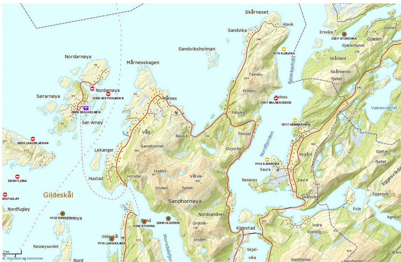
Figur nr. 2. Oversikt over lokalitetenes plassering i forhold til hverandre i Gildeeskål kommune. Lokalitetene Mulnesodden og Storevika, på innsiden og adskilt fra lokaliteter beliggende på yttersiden av Sandhornøya.

Selskapenes behov for lokalitet i et alternativt område, som anført i klagen og klagens motsvar, er vurdert både med hensyn på lusesituasjonen og sykdom. De momenter som i denne sammenheng er anført, er for det meste vurdert tidligere i forbindelse med sluttbehandlingen av søknadene. De nye momentene som anføres omhandler selskapenes framtidige behov. GIFAS fikk i januar 2016 klarert lokaliteten Storevika. Lokalitet Storevika ligger på innsiden av Straumøya, og slik vi ser det, kan ha de samme kvaliteter som Dalsvika når det gjelder å være smittemessig adskilt fra de øvrige lokaliteter til selskapet (Figur 2).