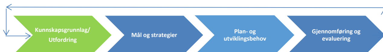
Forenklet plankretsløp (ref. Gildeskål kommune)

Vedtatt Kommuneplan (01.03.16) med Planstrategi (22.06.16) bygger på et Kunnskapsgrunnlag, ikke i form av et eget dokument, men basert på ulike delutredninger utarbeidet gjennom de siste år.