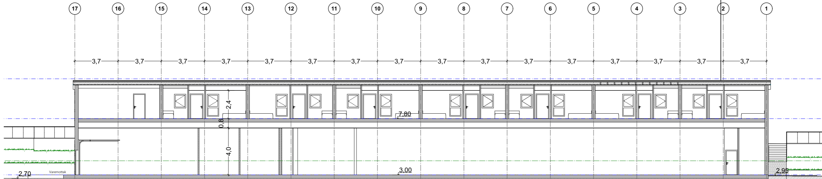
1:200 Snitt A